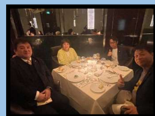
北澤会員夫妻、中西会員、福永会員