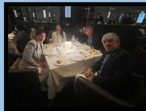
山森会員夫妻、乾会員夫妻