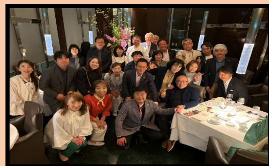
オーナーシェフと記念撮影

ミシュランガイドで星を獲得(長年にわたり高評価を維持)、国内外のグルメランキングでも上位常連で、日本のイタリア料理に貢献したと評価され、特にミシュランでの評価が象徴的で、「関西を代表するイタリアン」として知られる名店。